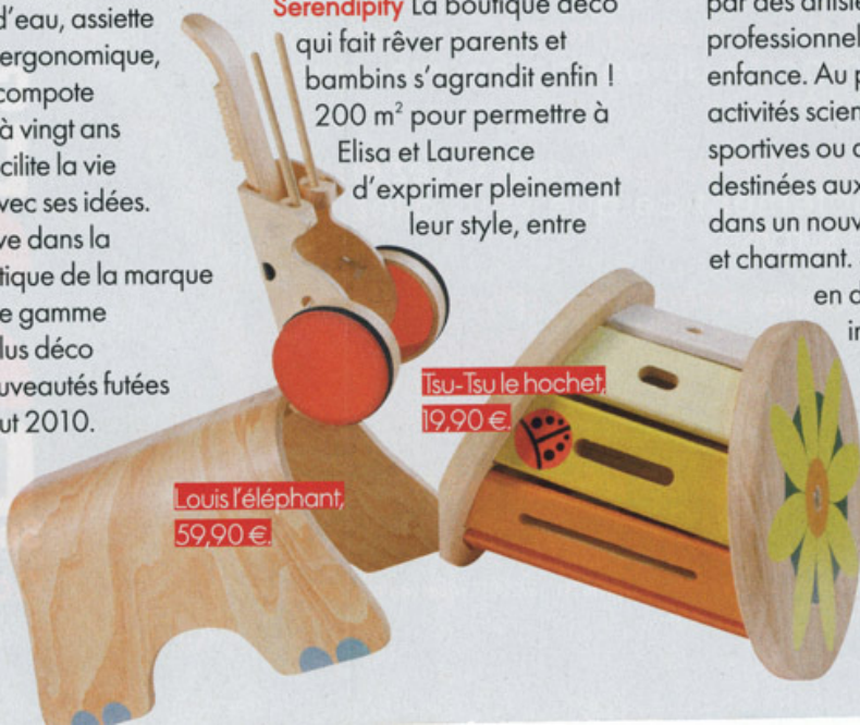
Louis l'éléphant, 59,90 €

Beaba Babycook, transat qui se règle à hauteur de table, tétine adaptable sur les bouteilles d'eau, assiette évolutive, pot ergonomique, gourde pour compote maison... Voilà vingt ans que Beaba facilite la vie des parents avec ses idées. A découvrir live dans la première boutique de la marque + une nouvelle gamme de couleurs plus déco + plein de nouveautés futées fin 2009-début 2010. On y fonce ! ■ 33, avenue de l'Opéra (2 e ). Tél. : 01 44 50 53 15.